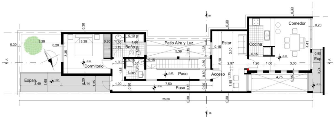
Plana Alta Ejecutada