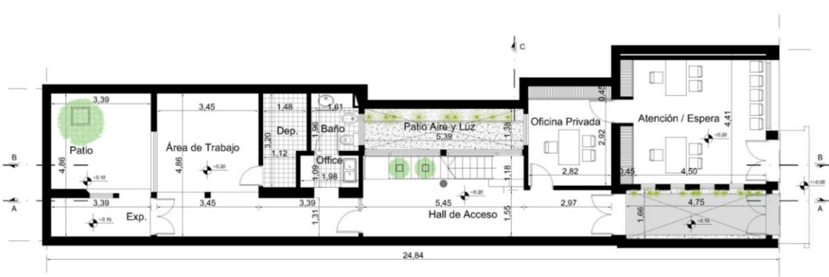
Planta Baja Ejecutada